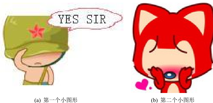
图 3.2: 包含子图形的大图形